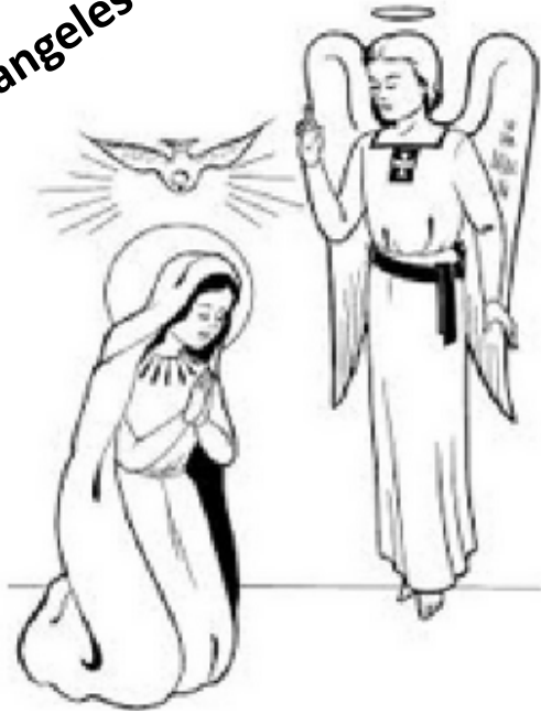
San Gabriel Arcángel – el mensajero