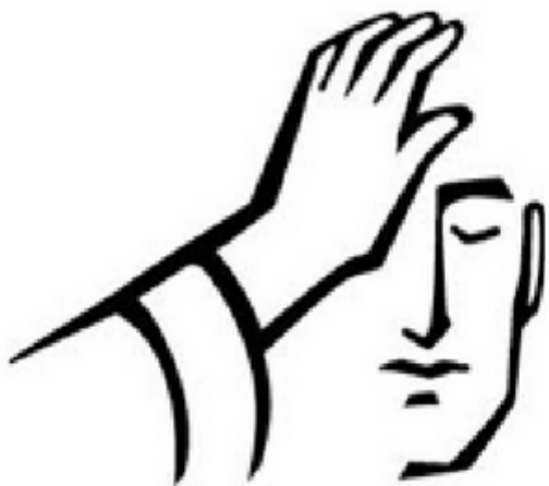
San Rafael Arcángel – el sanador