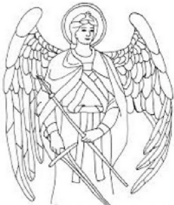
San Miguel Arcángel – el protector